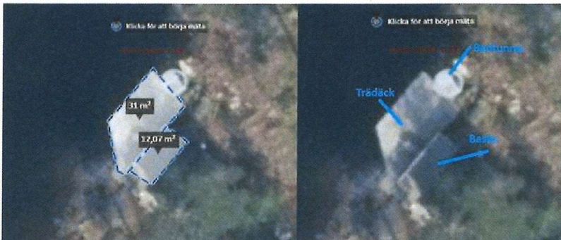
Bild 2. Överiktsortofoto