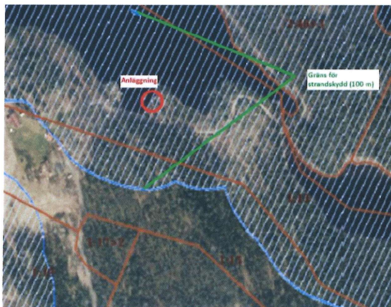
Bild 1. Översiktsortofoto

omfattas av strandskydd om 100 m (se Bild 1.).