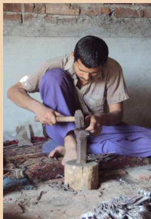
Instrumenttillverkning i Pakistan.