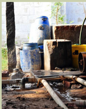
Kemikalier på färgeri, Tiruppur Indien.

Ett antal stickprover görs varje år då en fysisk revision i överenskommelse med aktuell leverantör, görs på plats i produktionen. De förbättringsåtgärder som identifieras, ska åtgärdas av leverantör inom skälig tid. Därefter delas rapporten till övriga landsting. Vi följer upp att åtgärderna genomförs.