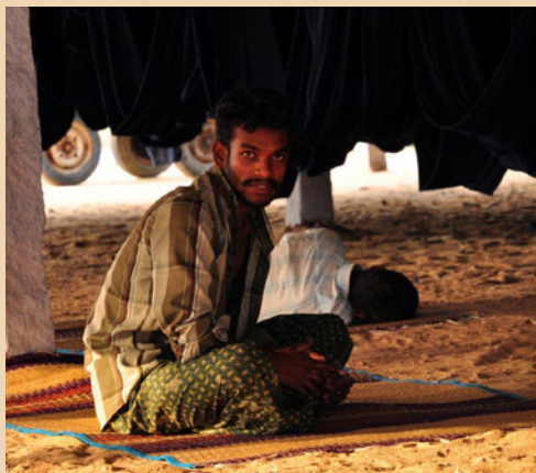
Timanställd tvätteriarbetare som villar i skuggan av torkande tvätt i väntan på att nästa färgbud skall bli färdigt. Tirrupur Indien

Sveriges regioner och landsting ansvarar för att alla invånare har tillgång till en god och väl fungerande hälso- och sjukvård, tandvård och kollektivtrafik. Tillsammans upphandlar vi produkter och tjänster till ett belopp om ca 120 miljarder kronor om året. Sveriges Landsting och regioner arbetar för en hållbar utveckling och i enlighet med det verkar vi för att de produkter och tjänster som köps in är framställda under hållbara och ansvarsfulla förhållanden. Många av de produkter som upphandlas framställs hos underleverantörer i fattiga länder där det finns risk att mänskliga rättigheter och trygga arbets- och levnadsvillkor åsidosätts. Därför måste vi ta ett eller flera steg bakåt i produktionskedjan och kontrollera att även våra leverantörers underleverantörer följer kraven. Genom att ställa sociala och miljömässiga krav i upphandling, och genom att noggrant följa efterlevnaden, bidrar hållbar upphandling till en hållbar utveckling.