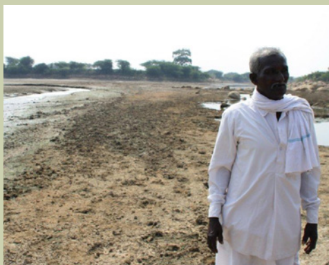
En av byborna utanför Hyderabad, Indien framför den sjö som tidigare användes för bevattning och som nu är förgiftad efter ut- släpp från bland annat läkemedelsindustrin.