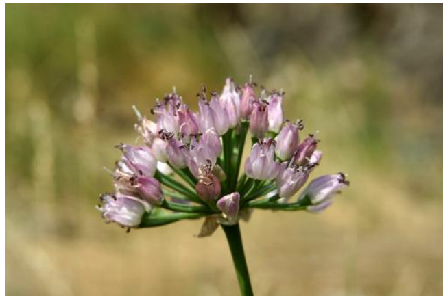
Kantlök vid Stora Le