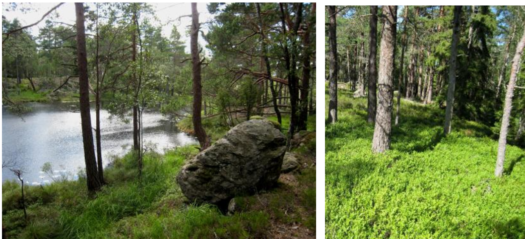
Hållmarkstallskog och blåbärsmarker på Buråsen väster om Haksjöarna

Vindkraftparkerna påverkar naturvårdens intressen främst genom nya vägar. Eftersom höjdlägen ofta har lågproduktiv skog eller impedimentartad skog (typ hållmarkstallskog) kan sådana områden vara jämförelsevis mindre påverkade av skogsbrukets avverkningar och vägar. Vindkraftparker kräver anläggning av vägar till alla vindkraftverk, vägar som är bredare än de som skogsbruket har behov av.