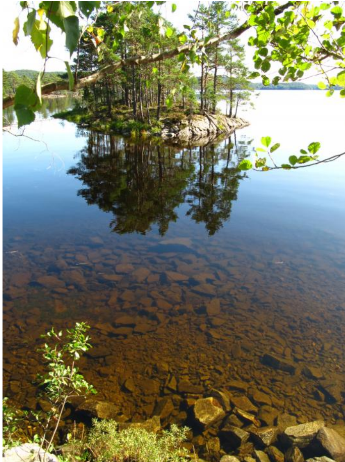
Stora Le från Rävmarken