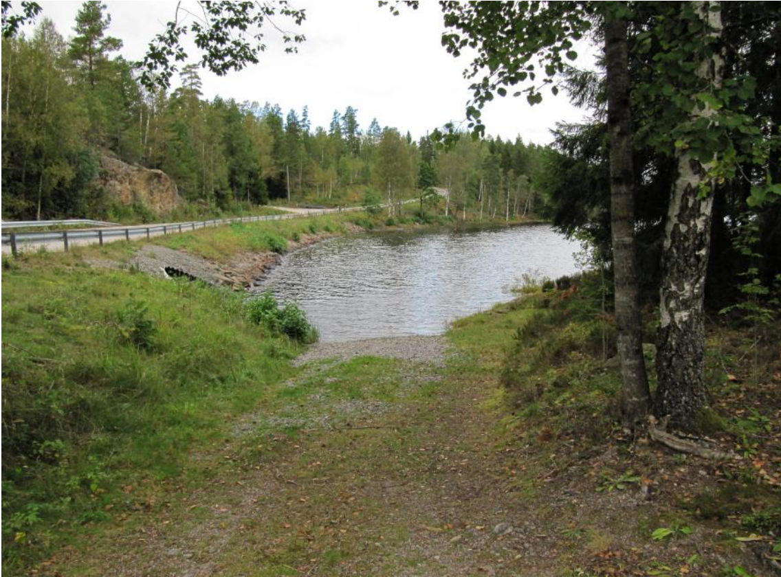
Sjösättningsplats vid Sandsjön