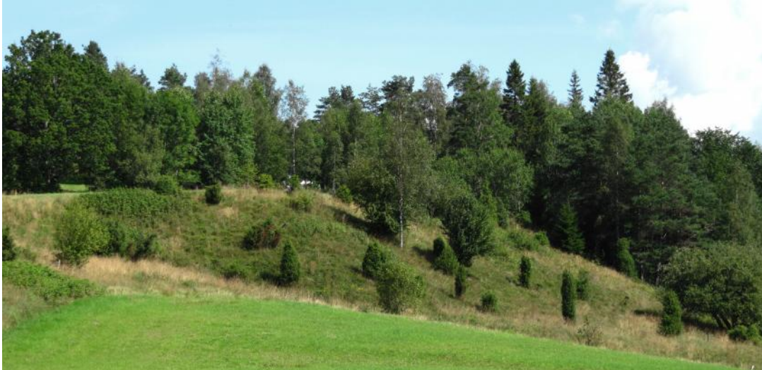
Odlingsmarker söder om Gesäter