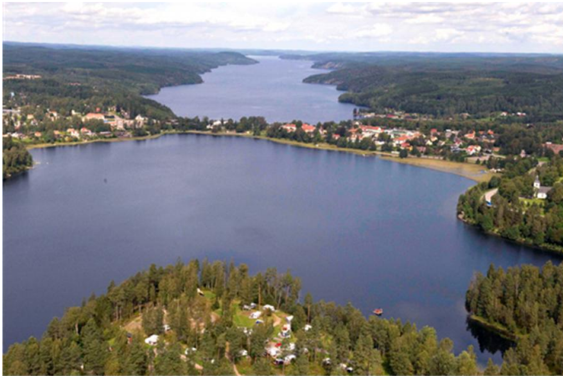
Lilla Le (i förgrunden), Stora Le och Eds samhälle

Kring tätorten Ed ligger ett stort område med isälvsdeltan och moränrygggar som kallas för Dals-Ed-komplexet. Det är en stor grusavlagring som ingår i den mellansvenska israndszonen som bildades under istiden för ca 11 000 år sedan. Lilla Le, som är belägen cirka 35 meter över Stora Le har ett mycket klart vatten och en värdefull fiskfauna. Stora Le är en stor sprickdalssjö, som nästan delar kommunen i en västra och en östra del. Den är drygt 100 meter djup och en av Sveriges djupaste sjöar. I Stora Le finns en unik fauna med relikta kräftdjur och en fisk, hornsimpa, från den tid denna del av landskapet var hav.