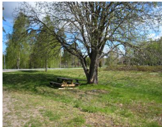
Rastplats vid Karl den tolfte's vörn

I ett av Dalslands miljökontors pågående projekt har försök påbörjats med insådd av vilda blommor på begränsade mindre ytor längs promenad- och cykelvägar och andra välbesökta platser i de fem största orterna i Dalsland. Insådd i Ed är planerad till 2012.