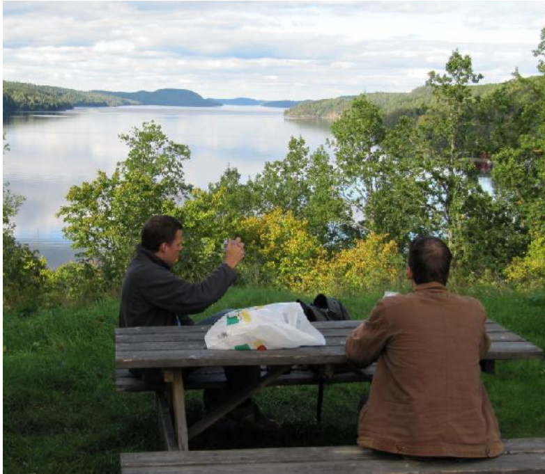
Enkel rastplats mot Stora Le

Populära platser kan kräva skyltning och skötsel i form av regelbunden städning. En långsiktig planering och finansiering behövs därför för denna typ av åtgärder. Ett ökat intresse från statens sida är önskvärt, särskilt för de områden som är av riksintresse för rörligt friluftsliv, men även för att underlätta besök i reservat och andra områden med utpekade naturvärden i den mån områdena kan bedömas tåla besökare och friluftsliv.