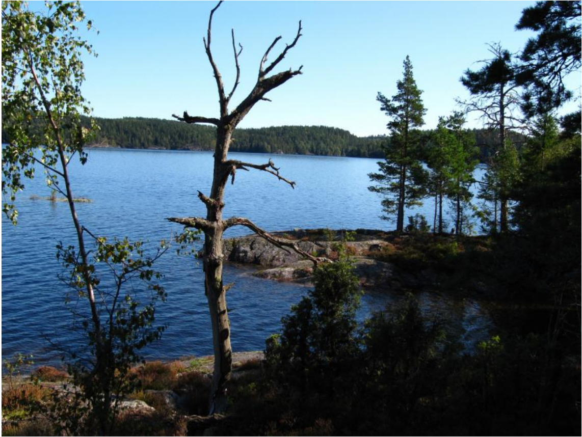
Stora Le från Rävmarken

I sluttningar och raviner mot Stora Le finns också inslag av naturskogar.