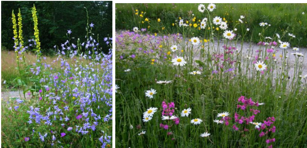
Bilderna visar exempel på insådda blommor i Håbols-Näs