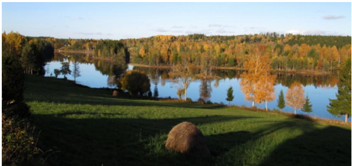
Sjön Grann från Strand

Även sjöarna Grann och Torrsjön i kommunens östra del har ett ovanligt stort antal fiskarter och inslag av relikta kräftdjur. Omkring sjöarna finns inslag av ädellövskog och hagmarker.