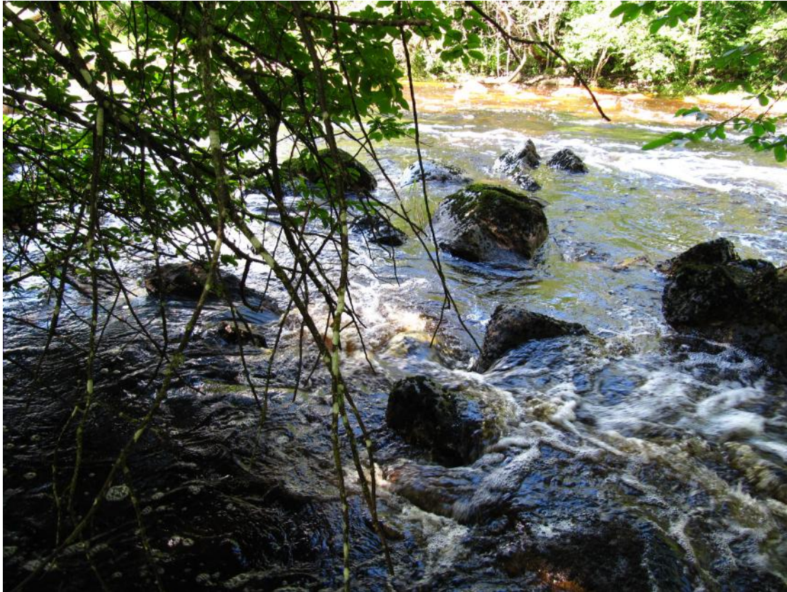
Forsar i Örekilsälven mellan Rölunda och Gesäter