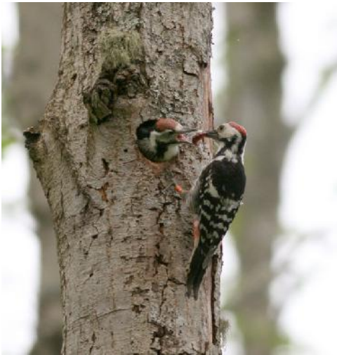
Vitryggig hackspett

häckning känd i Dalsland. Försök med utplantering pågår.