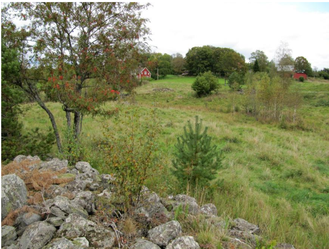
Odlingslandskap vid Risane

Det är viktigt med engagemang från både de berörda jordbrukarna och allmänheten. Det krävs också god kunskap om vilka åtgärder som behövs. Miljömålet påverkas av den gemensamma jordbrukspolitiken inom EU och många åtgärder utförs idag med hjälp av miljöersättningar