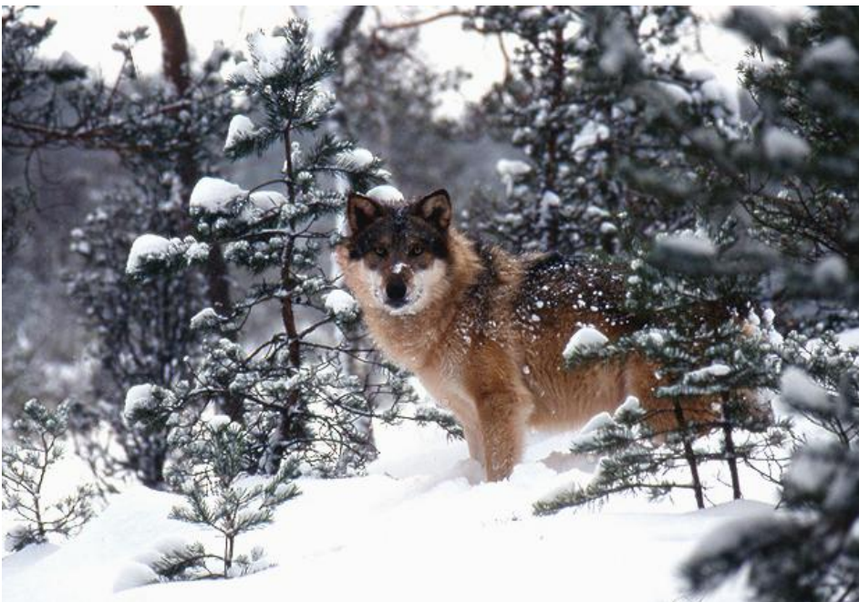
Varg (Tresticklan)