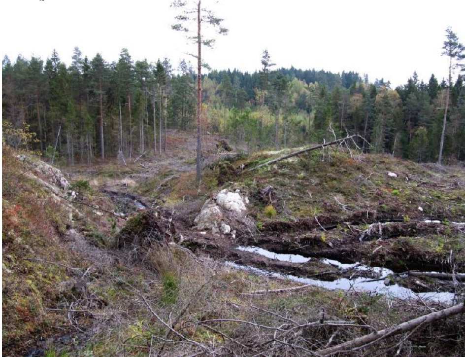
Skogsmark vid Valekullen strax intill Eds tätort

Tätortsnära skog på privata marker utanför Ed, men även intill övriga tätorter d.v.s. Nössemark, Håbol, Gesäter, Töftedal, Rölönda, har sannolikt också särskild betydelse för kommuninvånarnas friluftsliv. En dialog mellan boende, markägare, Skogsstyrelsen och kommunen skulle eventuellt kunna bidra till en skötsel med ökad hänsyn till friluftslivet.